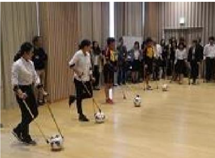
サプリメントプログラム (アンプティサッカー)