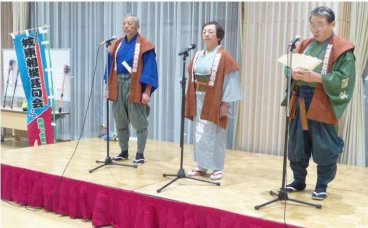
懇親会_江東区の『相撲甚句』