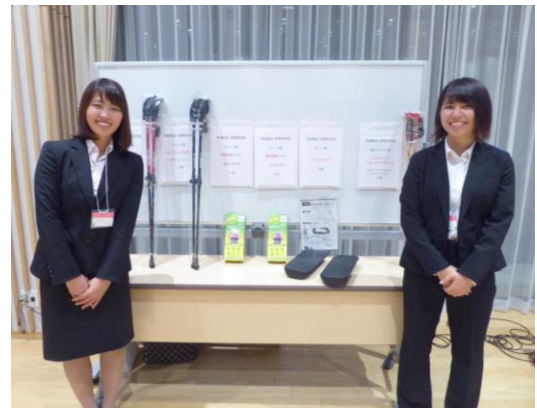
懇親会_協賛企業プレゼント企画