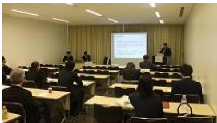
口頭発表 II (一般口頭発表)